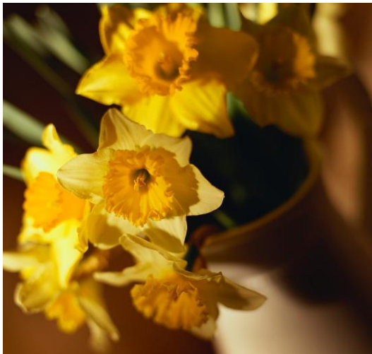
Figur 1. Påskeliljer.

Efter den koldeste marts i mange år er det endelig ved at være forår. Der ligger dog stadig is på søerne og sne rundt omkring.